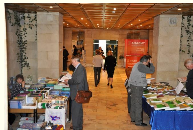
В кулуарах Второго съезда (2013 г.)

Сайт НСАХ РАН: http://www.rusanalytchem.org